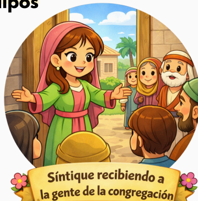
Síntique recibiendo a la gente de la congregación