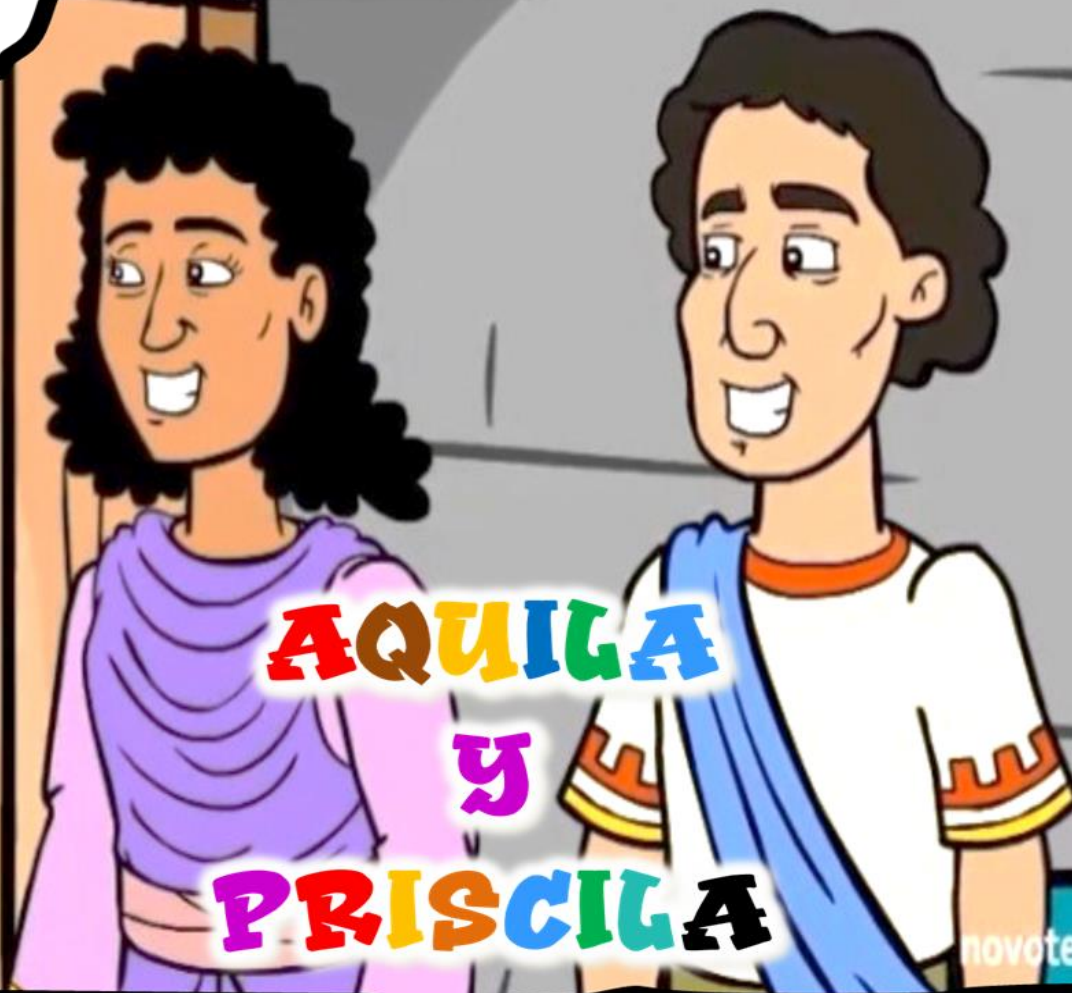
AQUILA Y PRISCILA