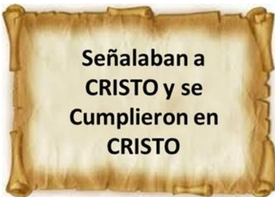
Imagen de muestra.

Así debe quedar el resumen en el cuaderno