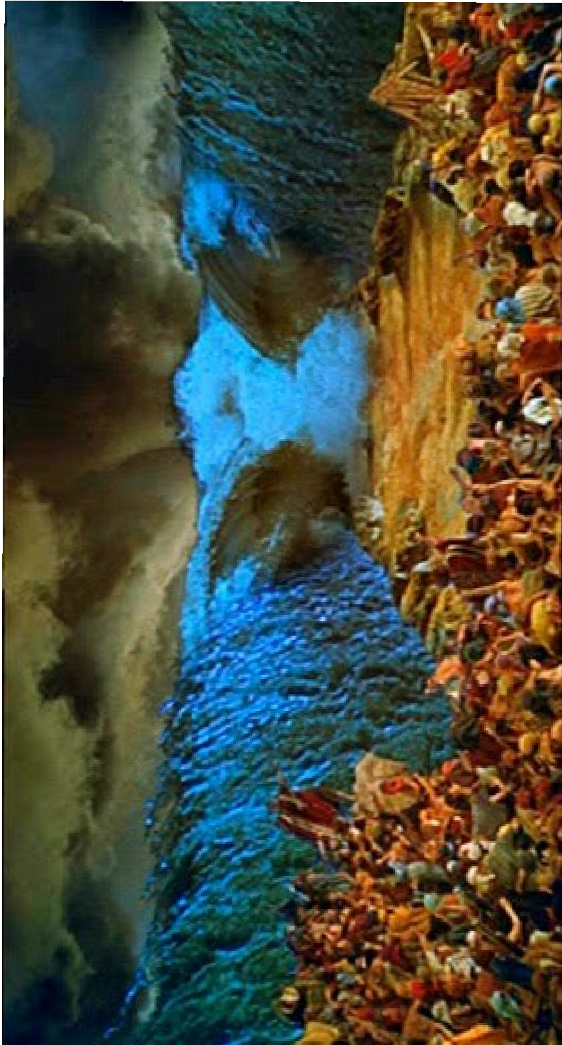
Salida del Pueblo de Israel de Egipto