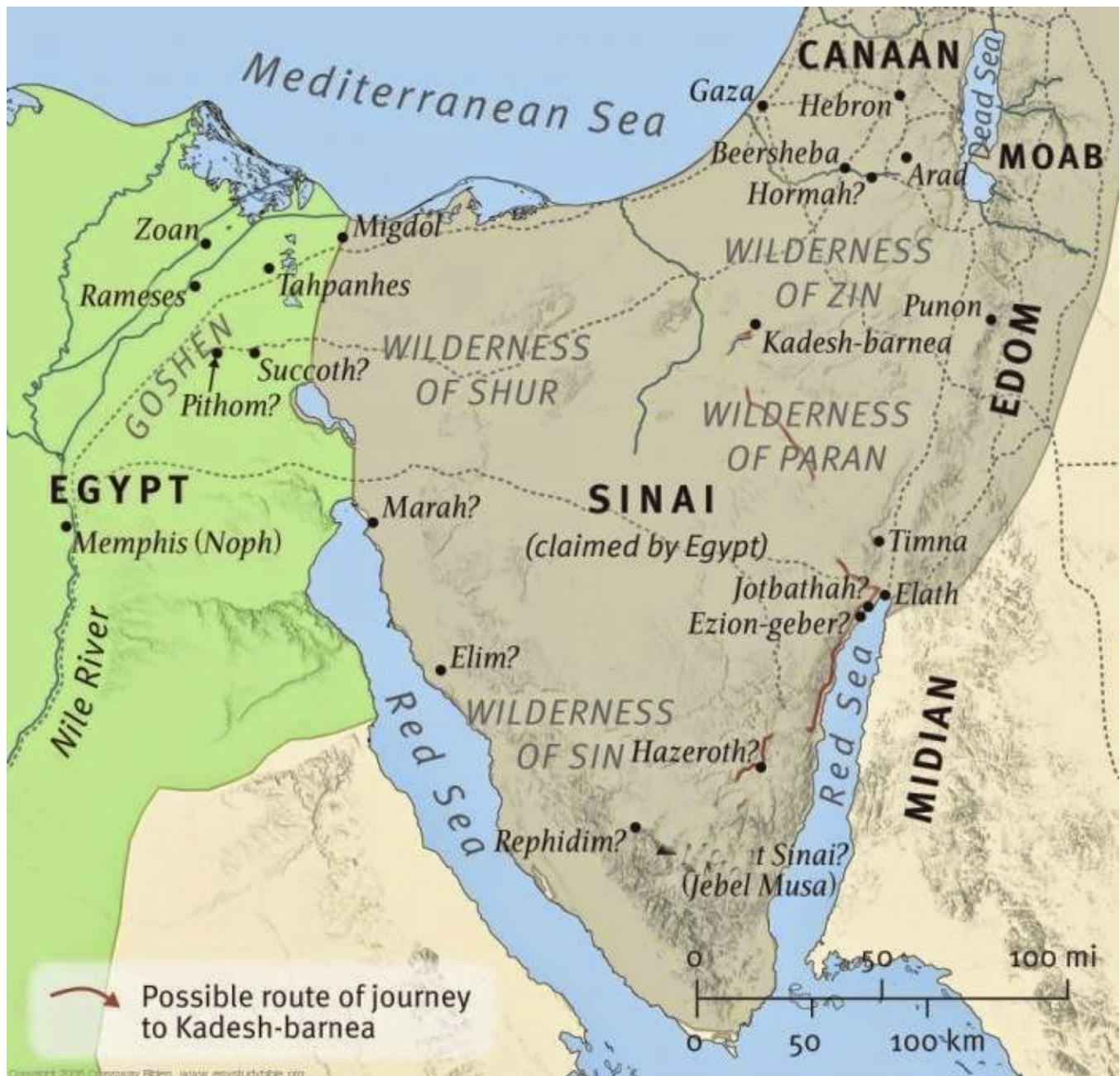
Ruta que siguió el Pueblo de Israel