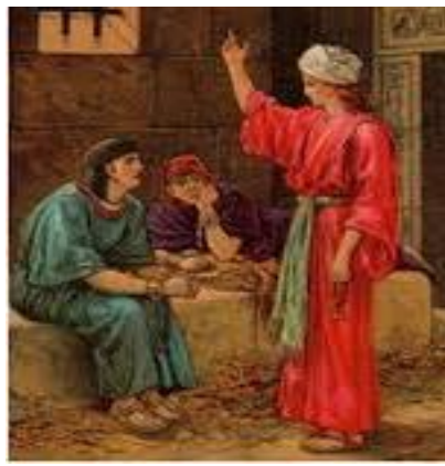
José declara en la cárcel el significado de los sueños del copero y el panadero del Faraón