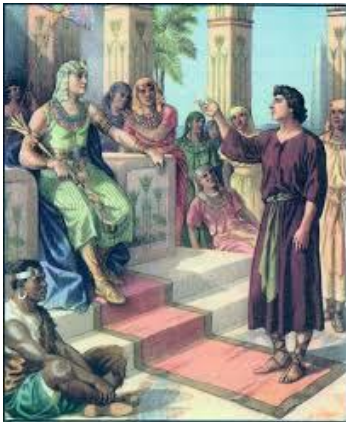
José le declara a Faraón el significado de sus sueños