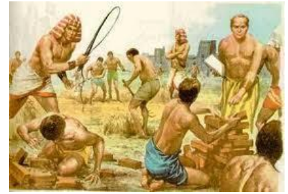
Los egipcios esclavizan y afligen a los israelitas