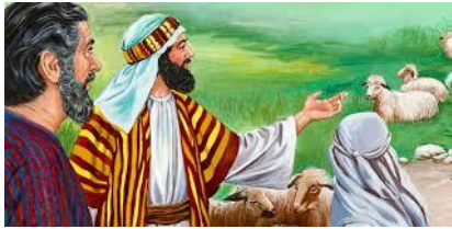
La familia de José reciben lo mejor de la tierra de Egipto para vivir y se llama el lugar :Gosén