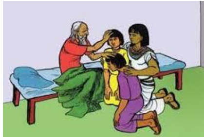
Jacob bendice a los hijos de José poco antes de morir