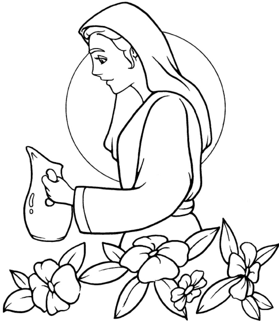
Una esposa para Isaac