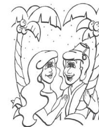
Isaac y Rebeca