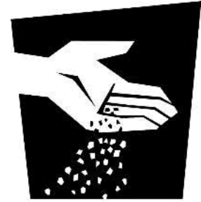
Grano de mostaza

Entonces el Señor dijo: Si tuvierais fe como un grano de mostaza, podríais decir a este sicómoro: Desarráigate, y plántate en el mar; y os obedecería. Lucas 17:6 (NVI)