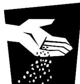
Grano de mostaza

Instrucciones: Las palabras de Lucas 17:5-10 (NVI)