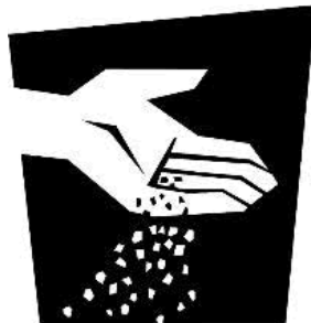
Grano de mostaza