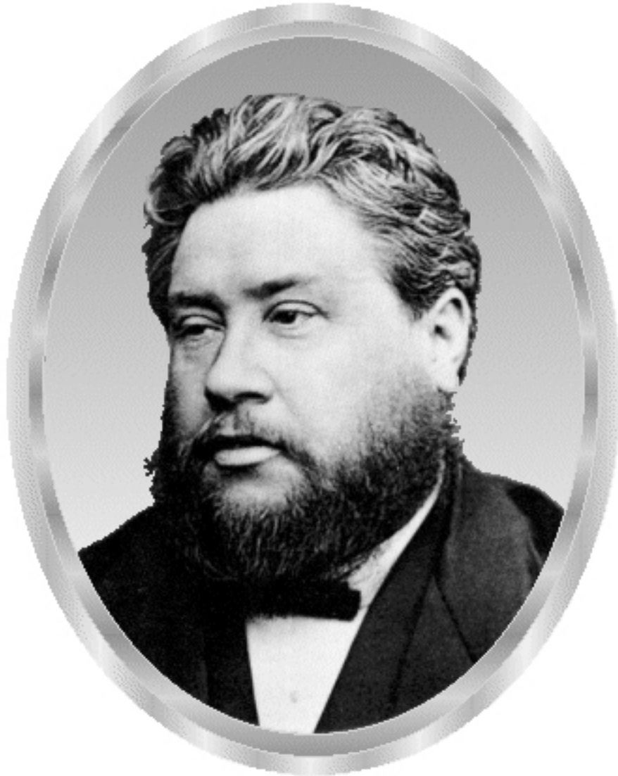
Charles H. Spurgeon Prince of Preachers