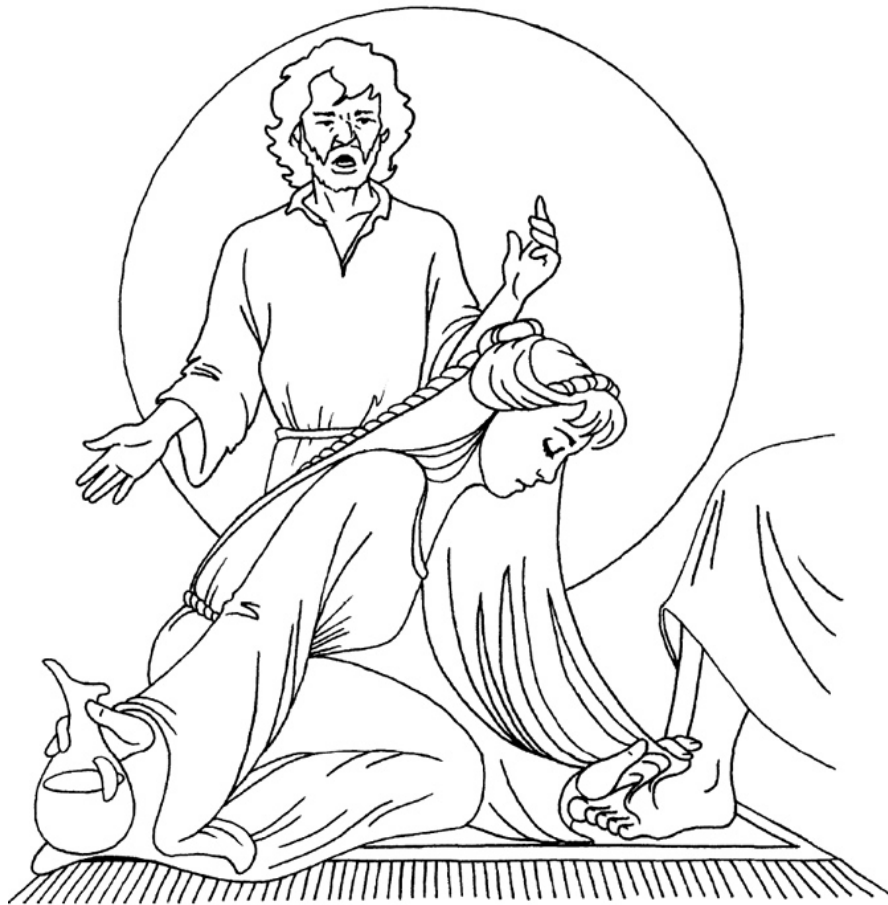
María unge a Jesús Juan 12:1-8