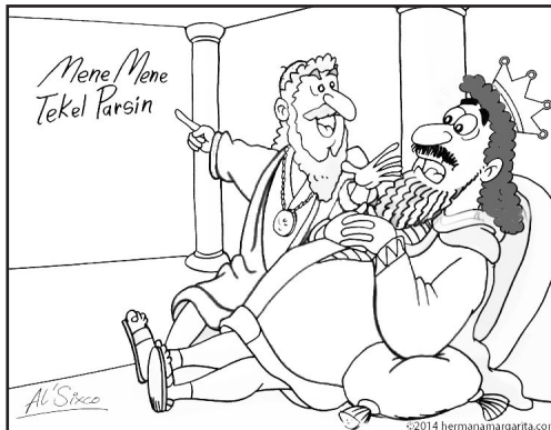
3. Daniel da la interpretación de la escritura al rey Belsasar