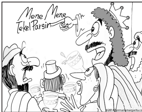
2. La escritura en la pared