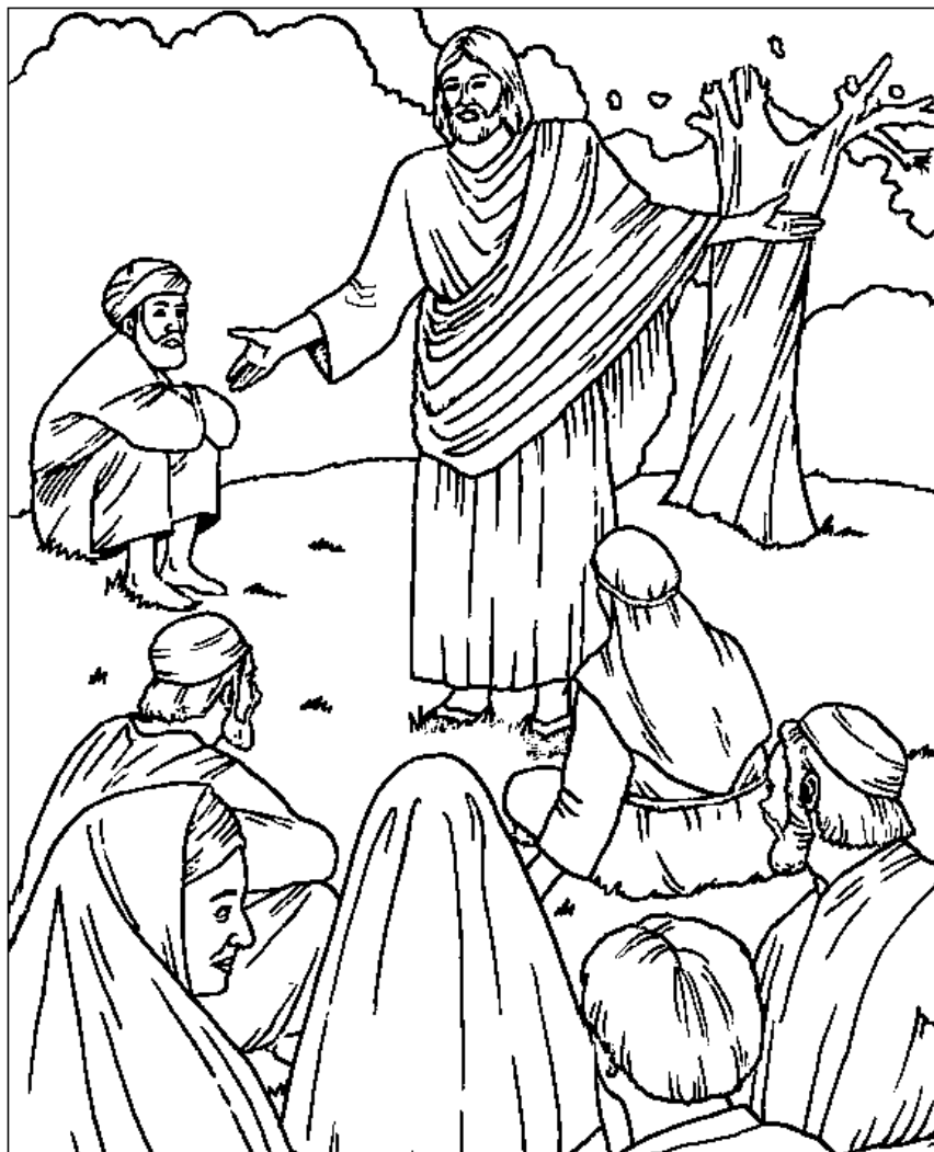
El sermón en la llanura

Cada número representa una letra del alfabeto. Sustituye cada letra por el número correspondiente para resolver las palabras secretas.