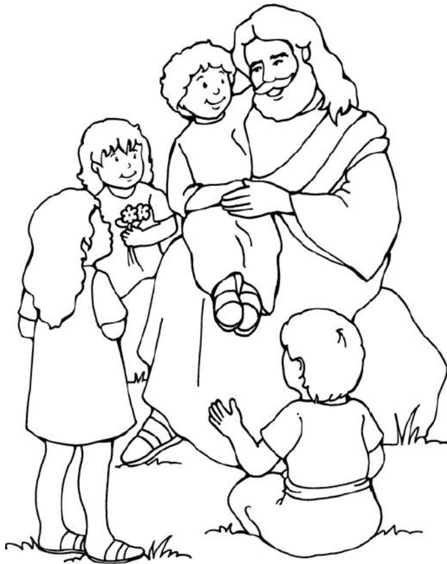
Jesús y los niños