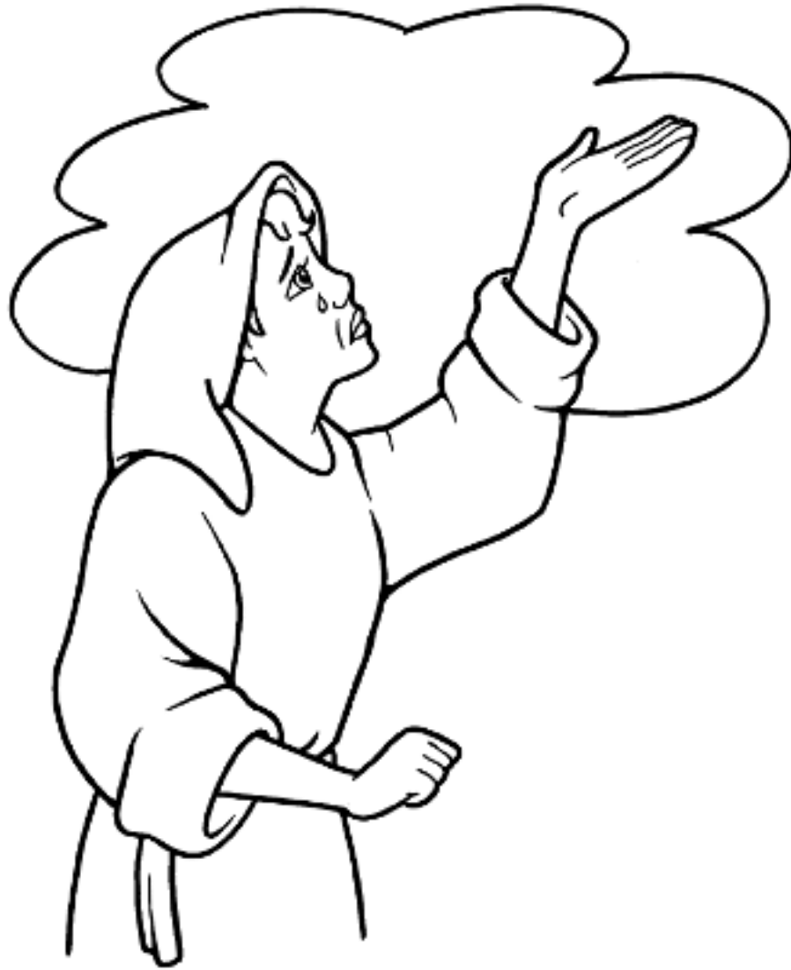
Ana ora por un hijo 1 Samuel 1:1-20