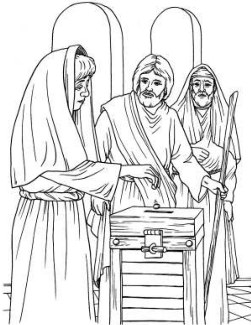
La ofrenda de la viuda Marcos 12:41-44

Cada número representa una letra del alfabeto. Sustituye cada letra por el número correspondiente para resolver las palabras secretas.