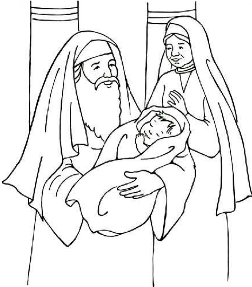
Simeón y Ana alaban a Dios Luke 2