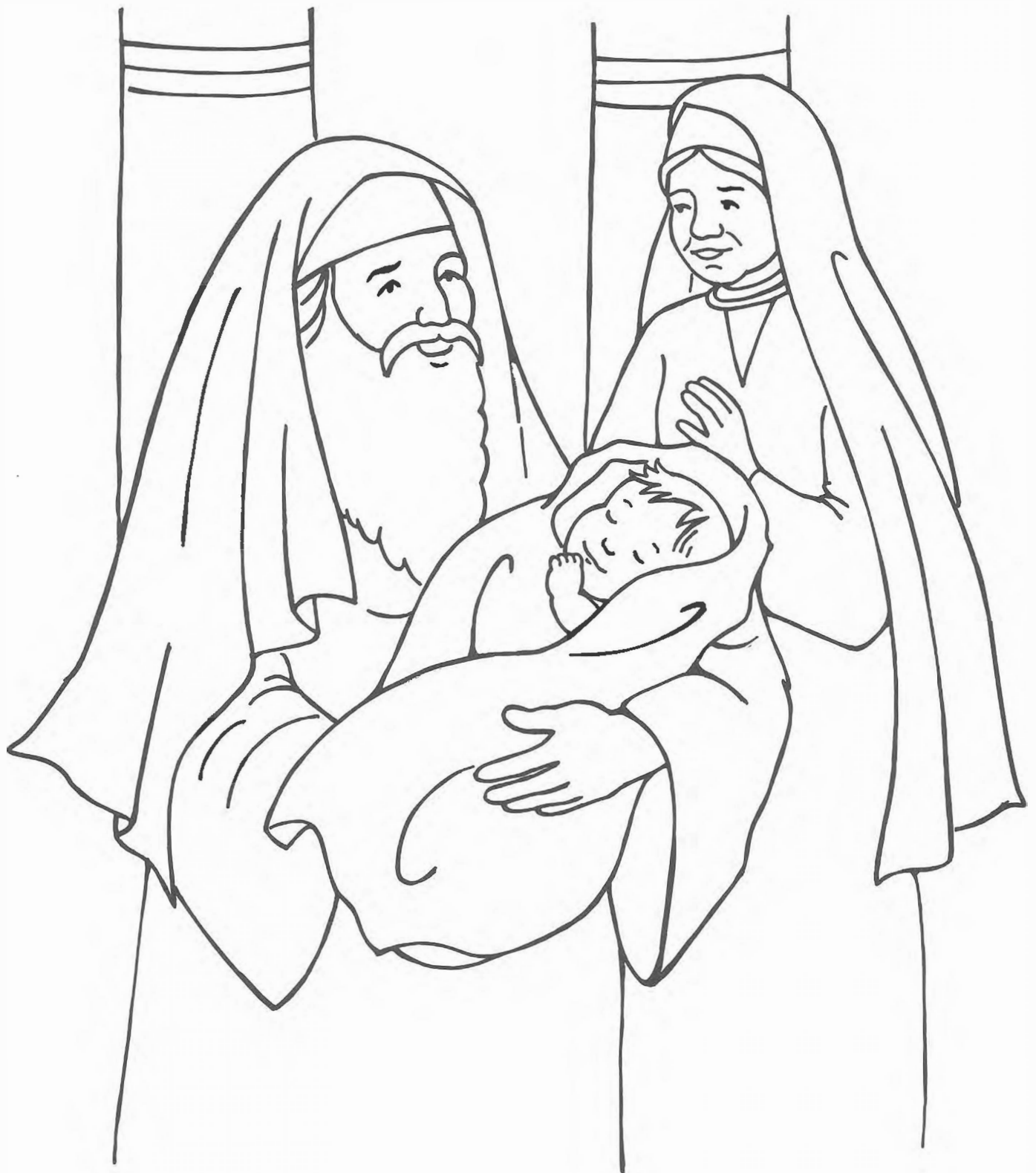
Simeón y Ana alaban a Dios Lucas 2