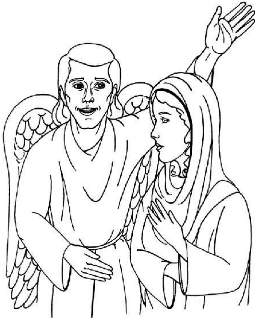
Un angel visita a María Lucas 1:26-38