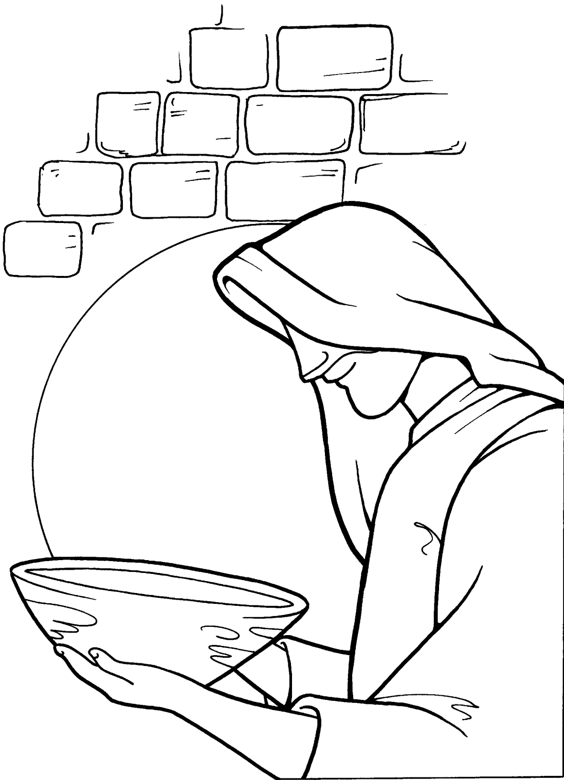
Jesús enseña acerca del servicio a los demás (Marcos 10:35-45)