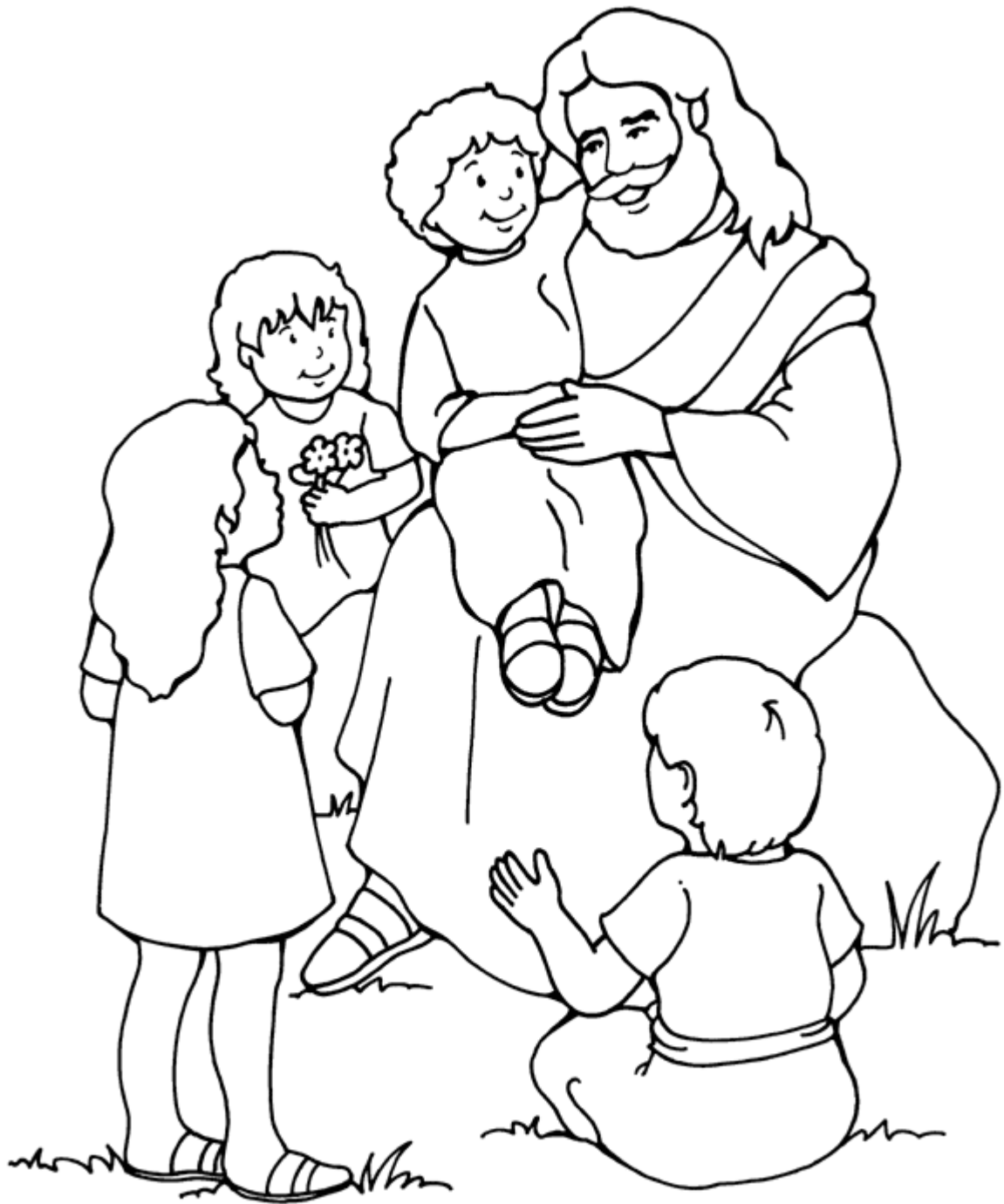
Jesús y los Niños