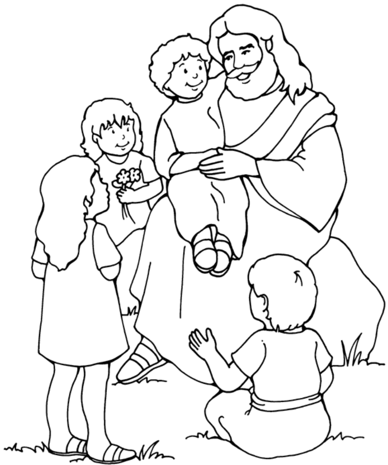
JESÚS Y LOS NIÑOS