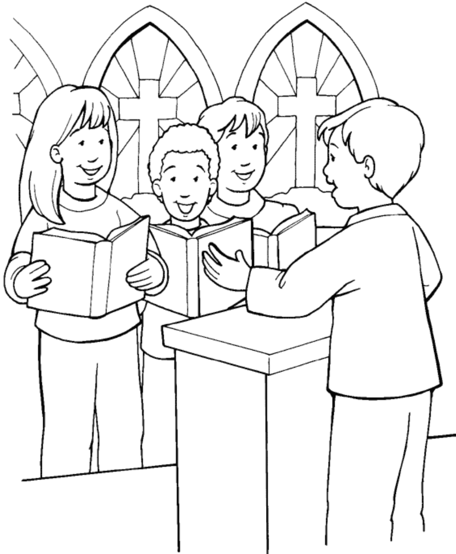
La Verdadera Adoración