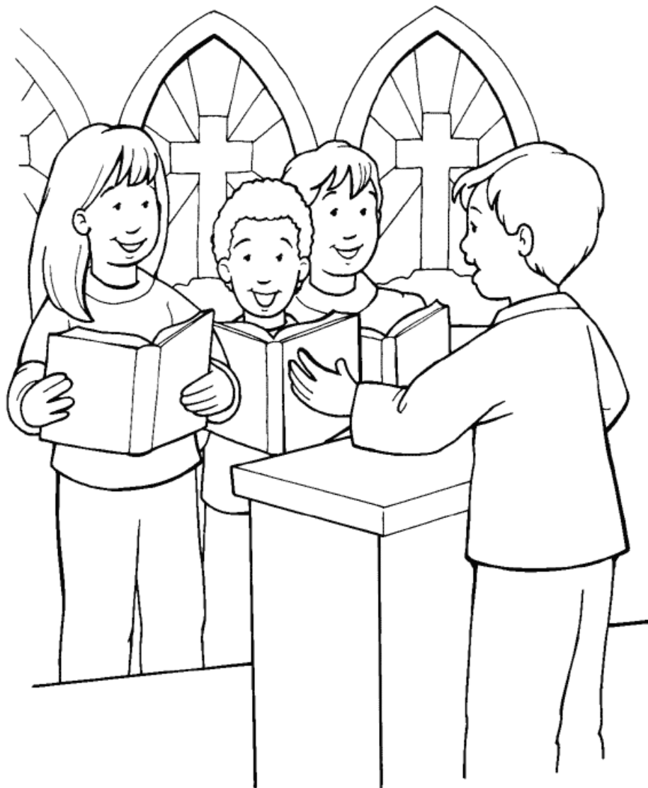
La Verdadera Adoración