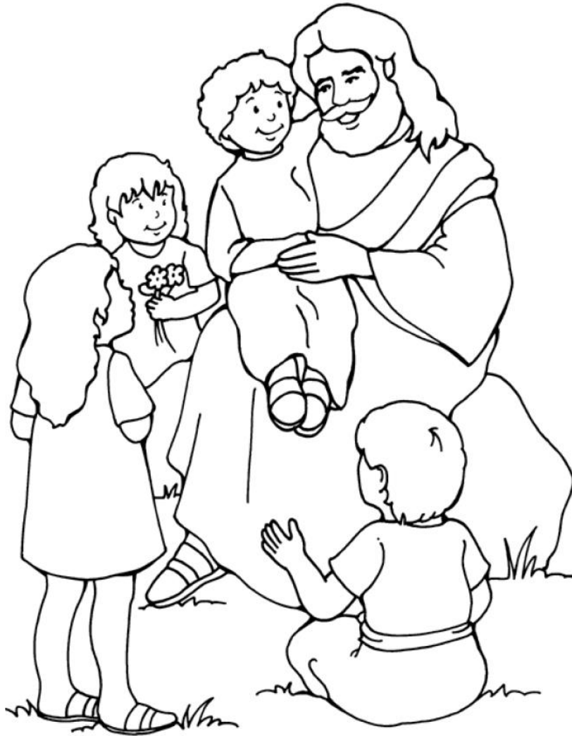
JESÚS Y LOS NIÑOS