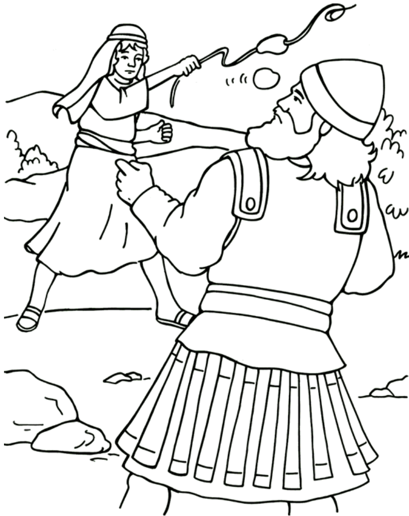
David y Goliat