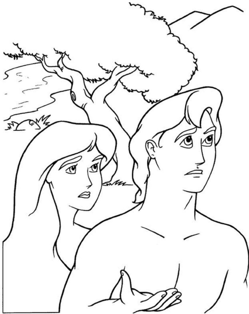
Adan y Eva son tentados