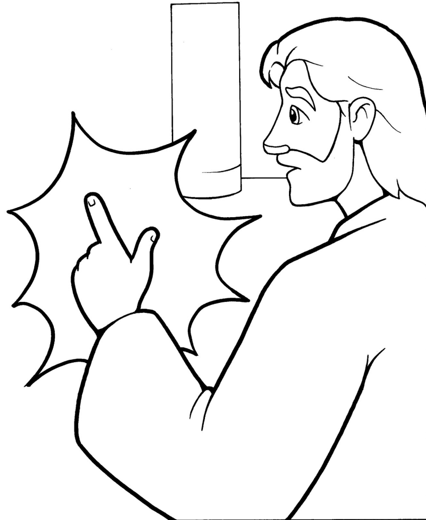
Jesús se aparece a los discípulos