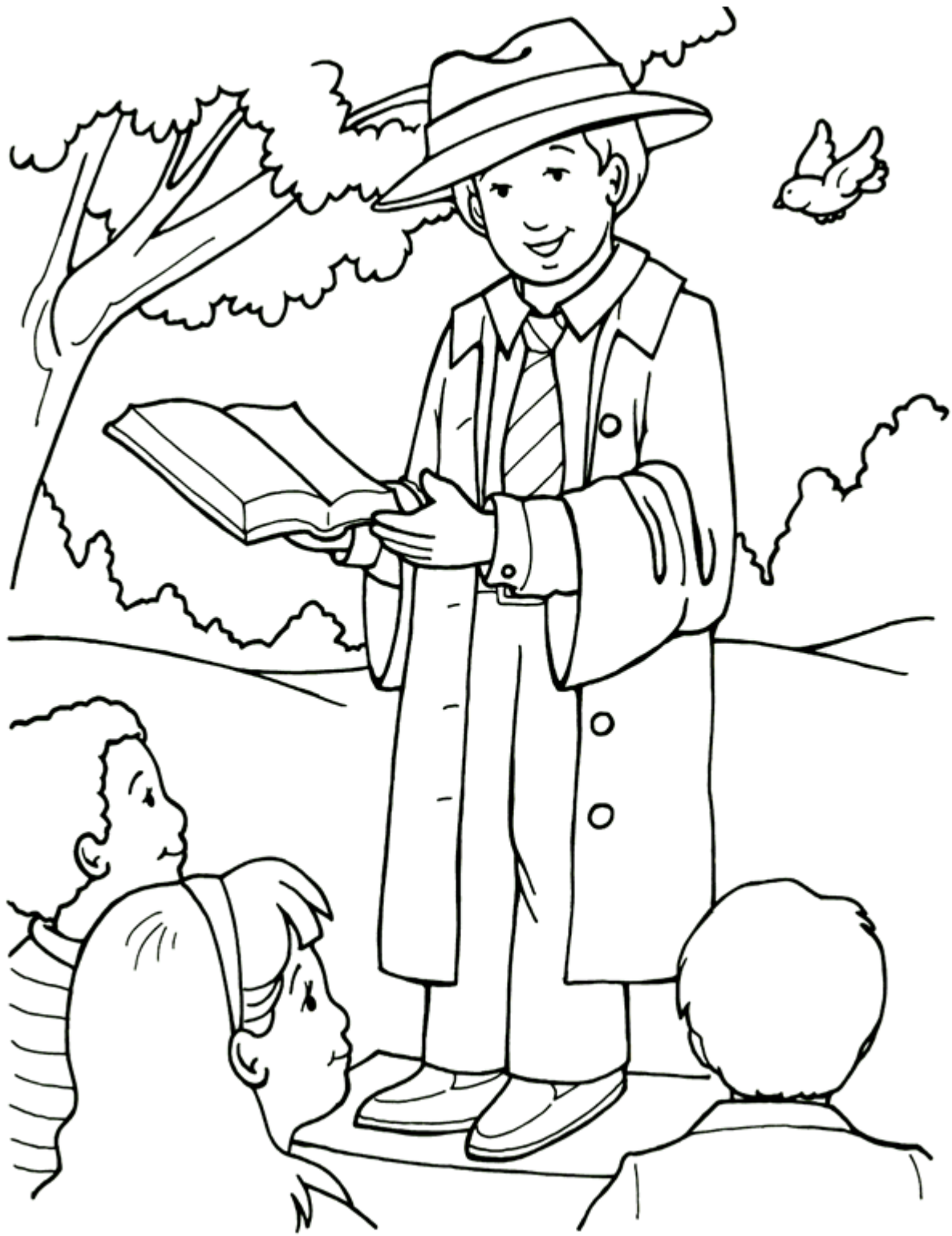
Predicando las buenas nuevas del reino.