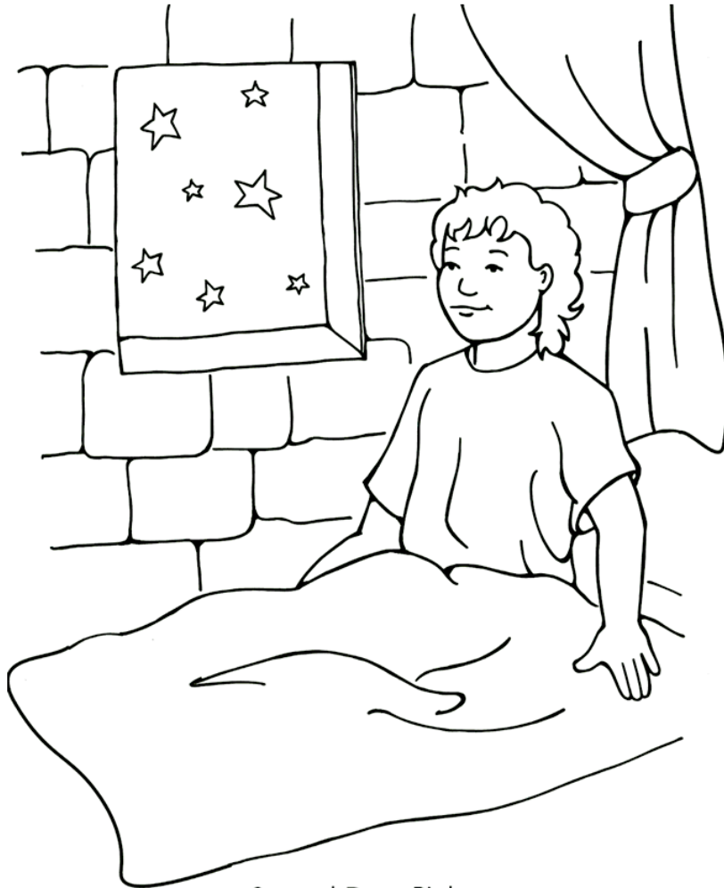
Samuel Does Right 1 Samuel 2-4, 7

Cada número representa una letra del alfabeto. Sustituye cada letra por el número correspondiente para resolver las palabras secretas.