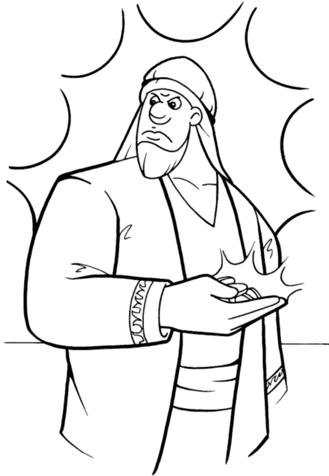
PARÁBOLA DE LOS TALENTOS (Mateo 25:13-40)