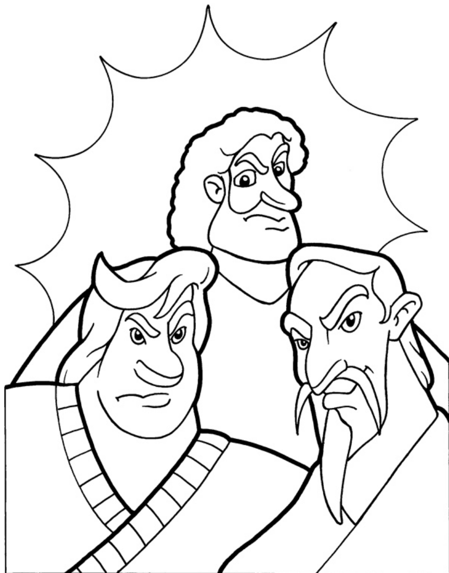
Parabola de los labradores malvados Mateo 21:33-45