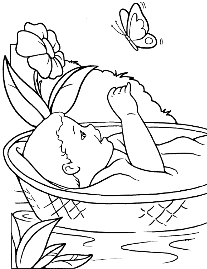
El bebé Moisés en el río