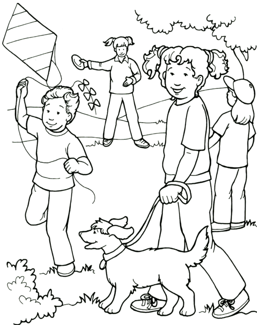
Jesús ama a todos