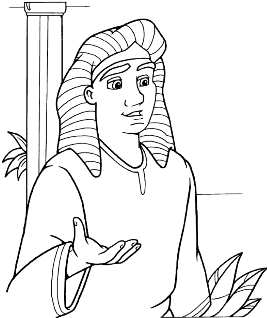
José se da a conocer