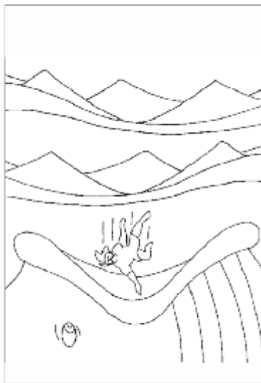
El profeta Jonás 775 a.C.

«Cree (señalar la cabeza) en el Señor Jesucristo (señalar la palma de cada mano) y serás (señalar a los demás niños) salvo (levantar las dos manos) – tú y tu casa (formar un triángulo con las manos sobre la cabeza).» Hechos 16:31