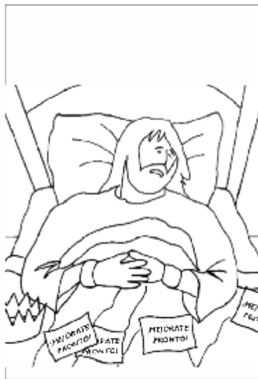
Rey Ezequías 700 a.C.