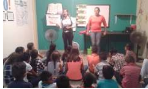
Daniel, Jonás Respuesta: 2 Reyes, 2 Crónicas, Ester, Jeremías,