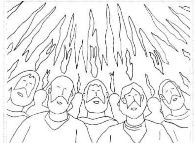
El principio de la iglesia D.C.