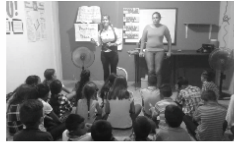
Daniel, Jonás Respuesta: 2 Reyes, 2 Crónicas, Ester, Jeremías,