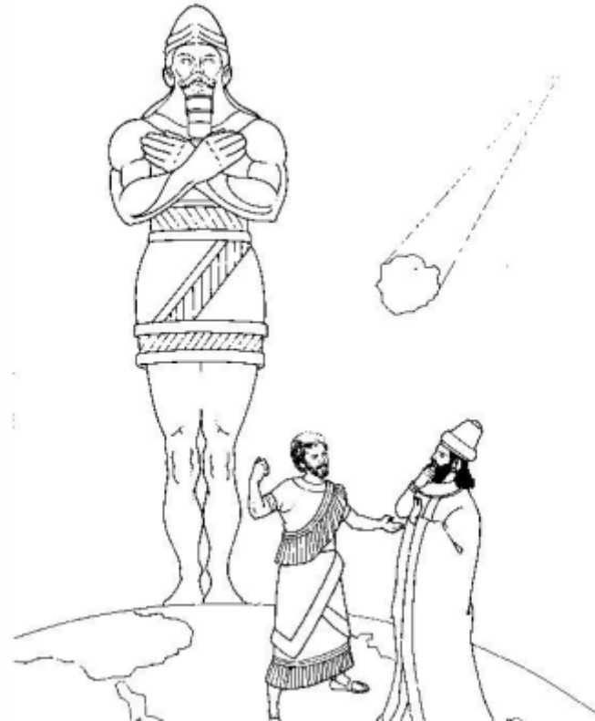
Daniel interpreta el sueño de Nabucodonosor