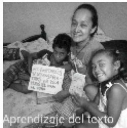
Aprendizaje del texto

Compartan el video con los maestros de sus iglesias para que lo compartan en las redes sociales.