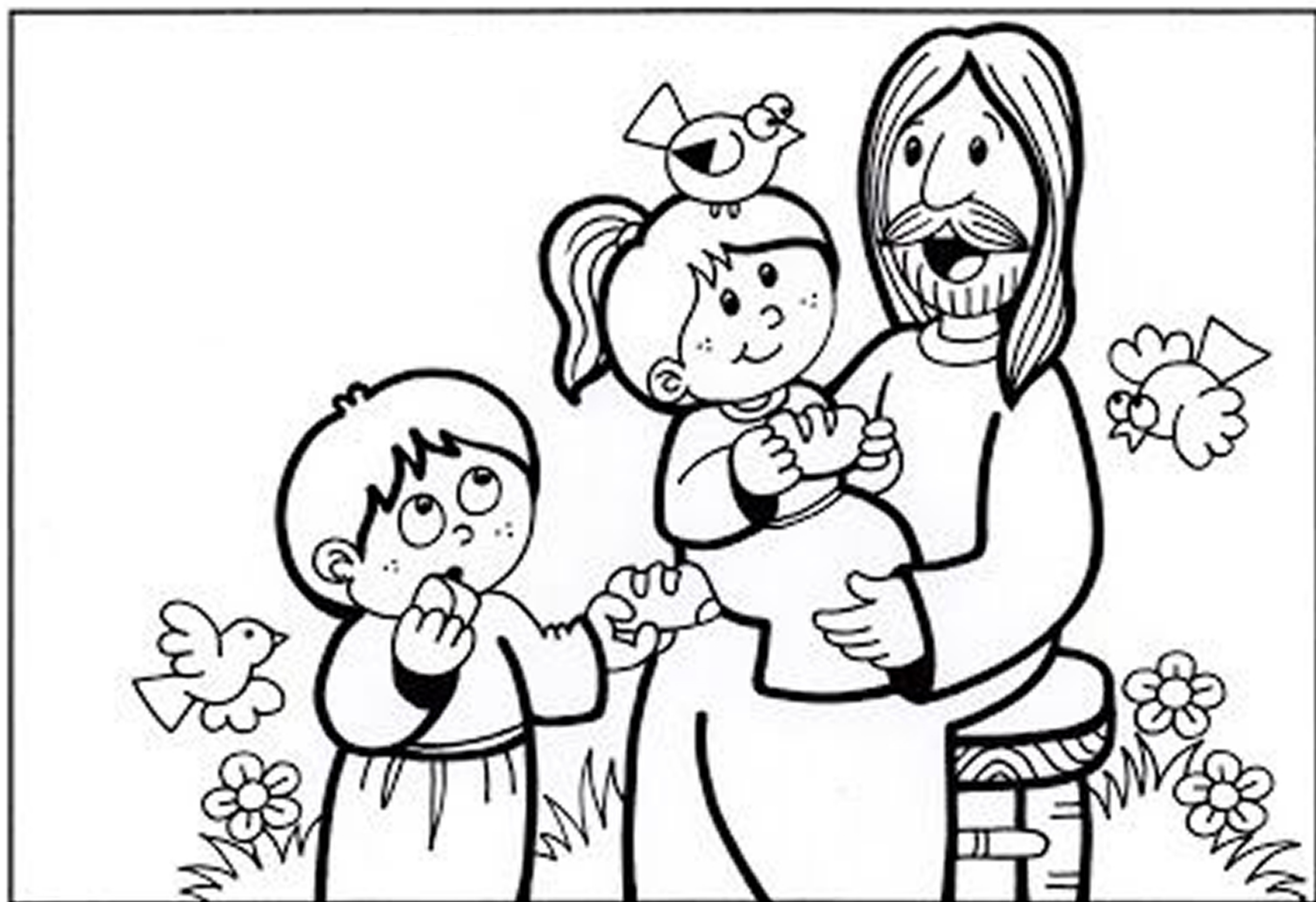
Imagen: Las melli

Mas a todos los que le recibieron, a los que creen en su nombre, les dio potestad de ser hechos hijos de Dios; Juan 1:12